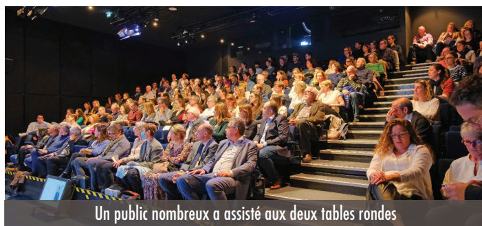
Un public nombreux a assisté aux deux tables rondes

Biologistes médicaux, chirurgiens-dentistes, infirmiers, masseurs-kinésithérapeutes, médecins, orthophonistes, sages-femmes, pharmaciens, orthoptistes et pédicures-podologues. Tous ont répondu présents, ce 7 mars, à Montpellier, pour la première soirée organisée par l'inter union régionale des professionnels de santé en Occitanie. Étaient aussi présents plusieurs représentants de l'agence régionale de santé